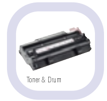
Toner &amp; Drum